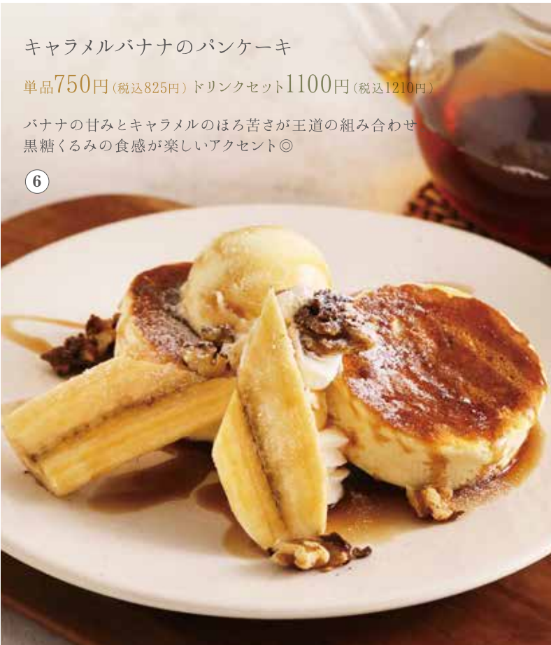
キャラメルバナナのパンケーキ