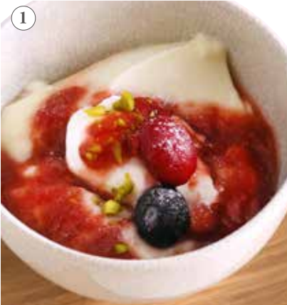
苺ベリーの豆乳プリン

こななの自家製豆乳プリンは、ふんわりなめらかな口溶けがクセになる美味しさです。こななに来たら一度は食べて欲しい自慢の一品。