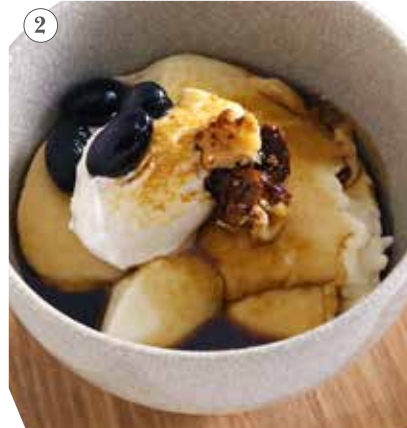
黒蜜きな粉の豆乳プリン