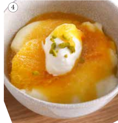
温州みかんの豆乳プリン