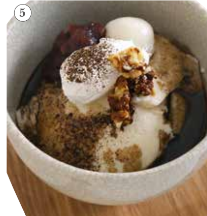
八女ほうじ茶の豆乳プリン