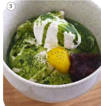
八女抹茶の豆乳プリン